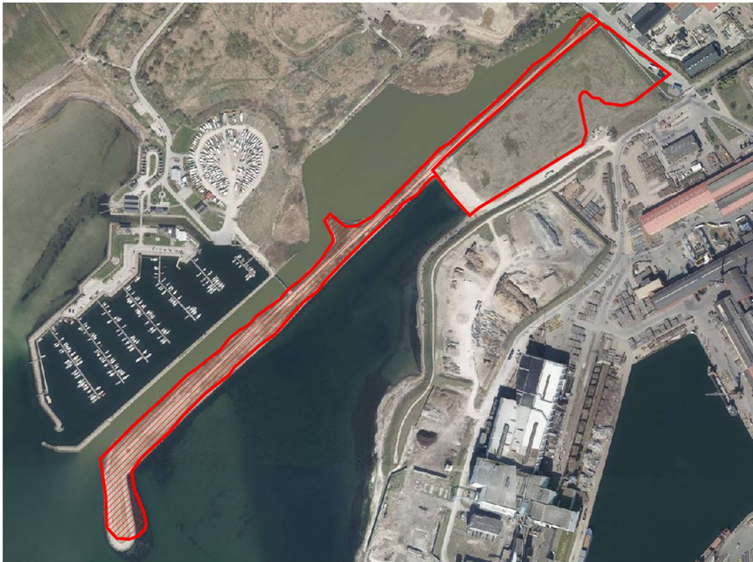
Rammeområde 4.T1 før og efter ændring af omfang – se tekst nedenfor

Rammeområde 4.R5 ændres til 4.T1 og indskrænkes fra det på kortet med rødt indrammede område (yderste røde kreds) til det med rødt indrammede og med rød skravering angivne område, der alene omfatter den matrikulært udlagte del af Slaggemolen, som hidtil har